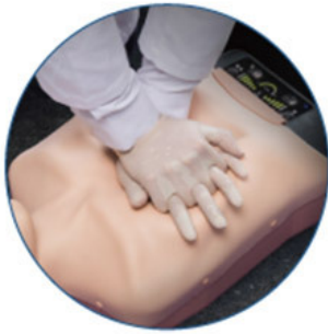
Chest Compression & Ventilation