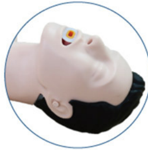
Insert NPA / OPA