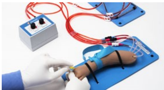
Externí zásobník krve pro nepřetržitý přísun tekutin, natlakování cév a možnost pozorování zpětného tlaku.