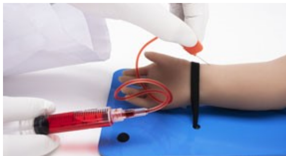
Radiální a brachiální arteriální přístupová místa pro kanylaci a odběr krve.