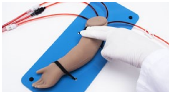
Hmatatelný radiální a brachiální puls.