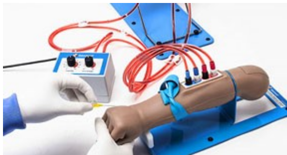
Externí zásobník krve pro nepřetržitý přísun tekutin, natlakování cév a možnost pozorování zpětného tlaku.