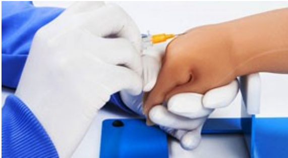
Realistická kůže zaručuje realistický vzhled a pocit při provádění úkonů.