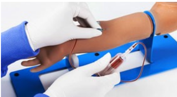
Kubitální a ulnární venózní přístupová místa pro kanylaci, infuzi, bolusovou injekci, odběr krve