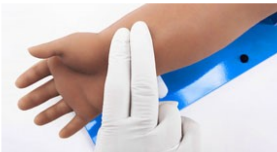
Hmatatelný radiální a brachiální puls.