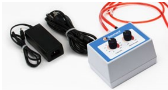
Elektronicky nastavitelná síla a frekvence pulzu (0 - 180 BPM).