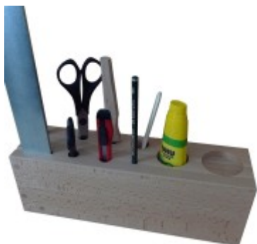
Sada nářadí - papír