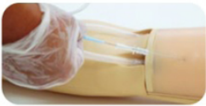
Zavedení vodícího drátku