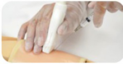
Punkce prováděná pomocí ultrazvuku