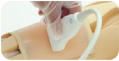
Výběr punkčního místa